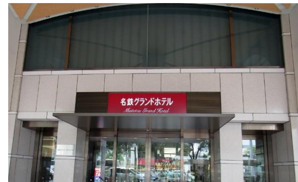
会場・名鉄グランドホテル