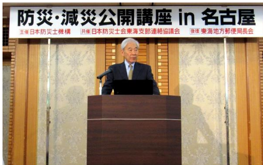
主催者挨拶 鈴木正明 日本防災士機構理事長