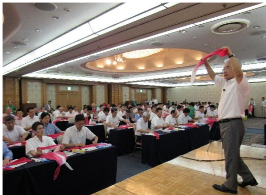
講師実技指導場景