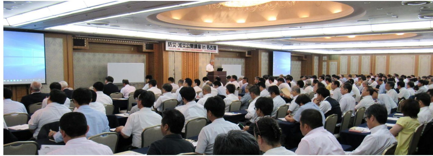
公開講座名古屋会場全景