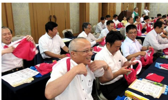
実技講習で盛り上がる参加者