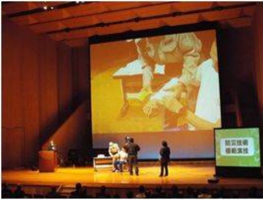
防災模範演技 仙台市消防局