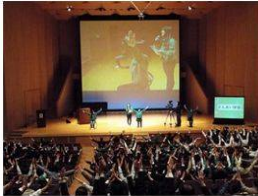
さんあい体操実演 東北福祉大学防災士協議会