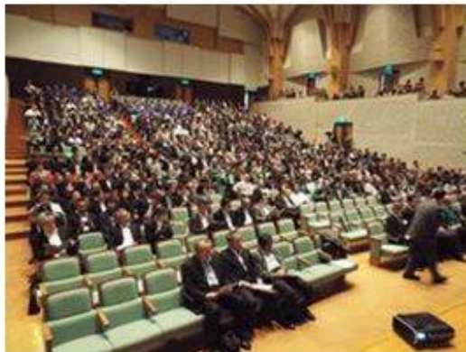
げやきホールを埋めつくした700名の観衆