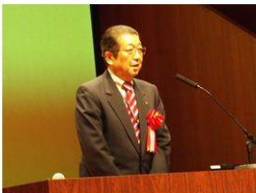
宮城県 石森危機管理監