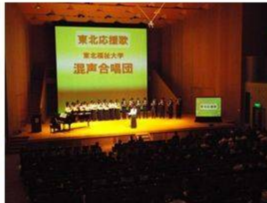
混声合唱団出演 東北福祉大学混声合唱団