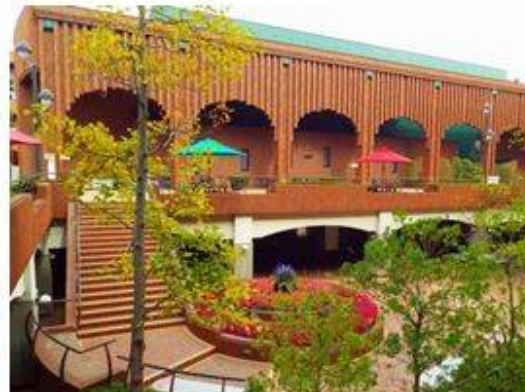
けやきホール外観