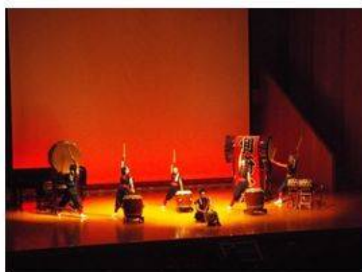
和太鼓演奏 利府太鼓