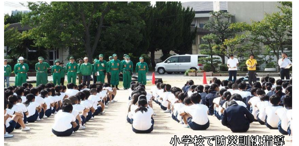
小学校で防災訓練指導