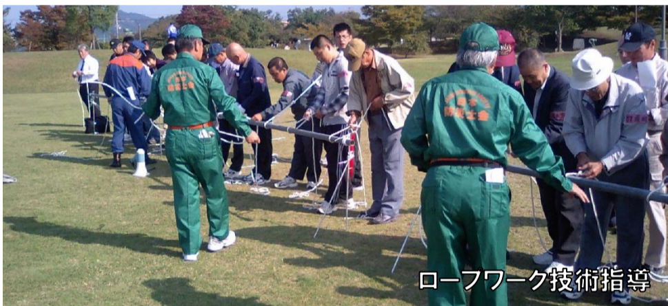
ロープワーク技術指導