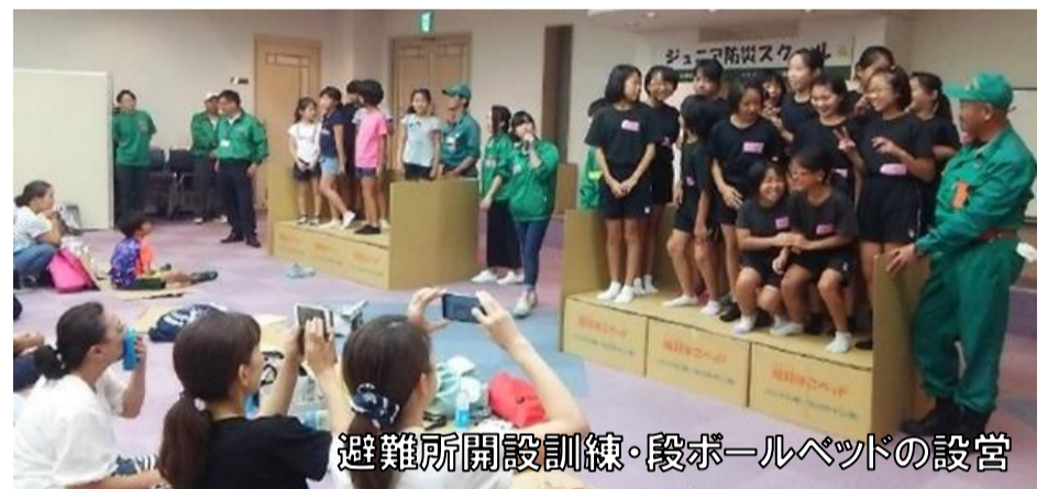
避難所開設訓練・段ボールベッドの設営