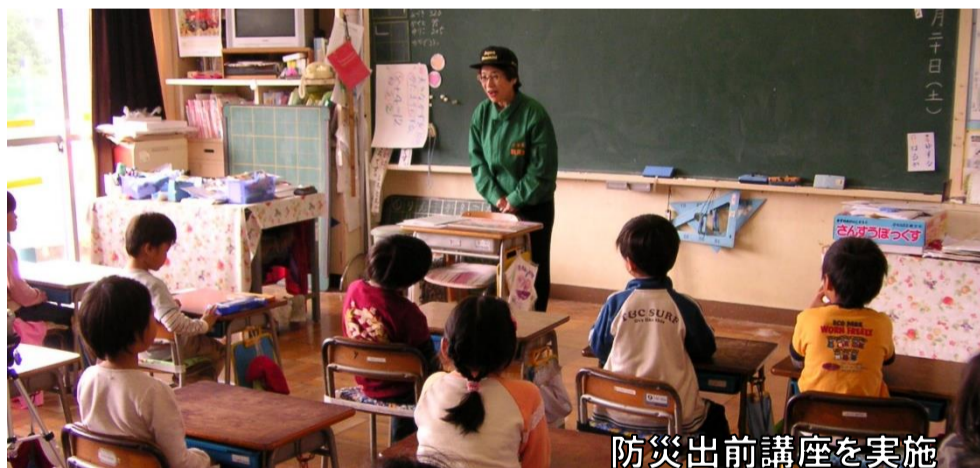
防災出前講座を実施