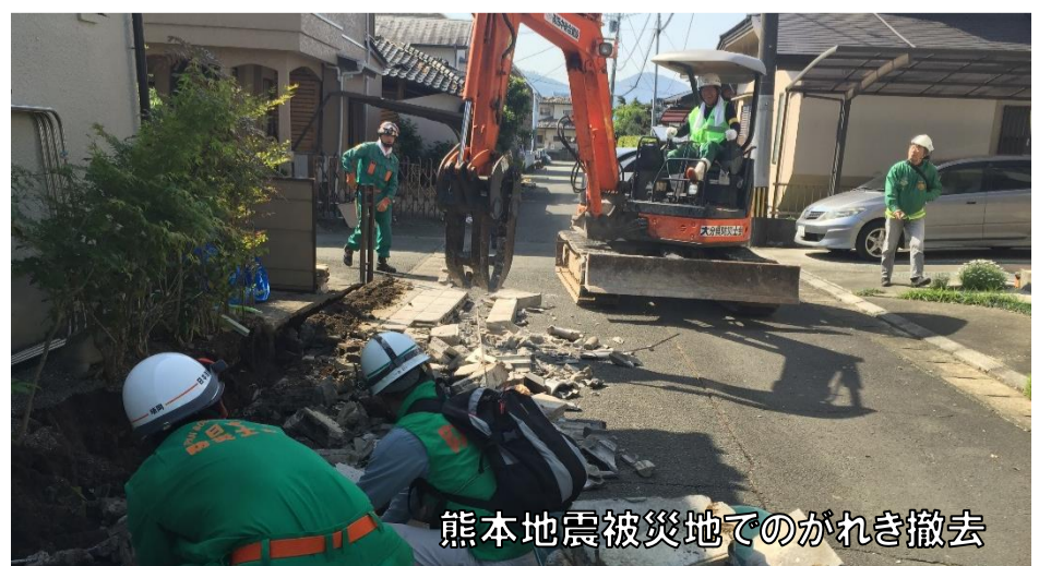
熊本地震被災地でのがれき撤去