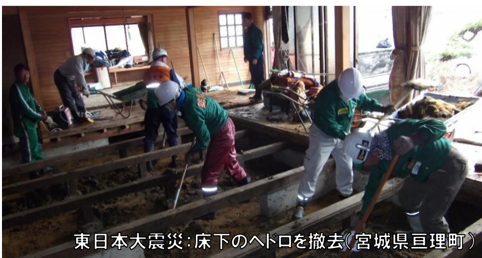
東日本大震災：床下のへド口を撤去（宮城県亘理町）